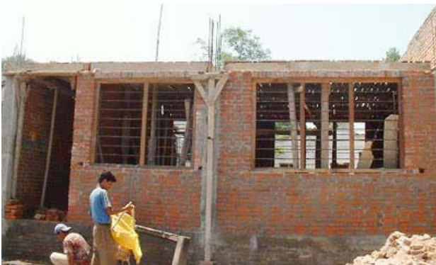
Rohbau des Erdgeschosses der Erweiterung der Sahayogi-Schule.