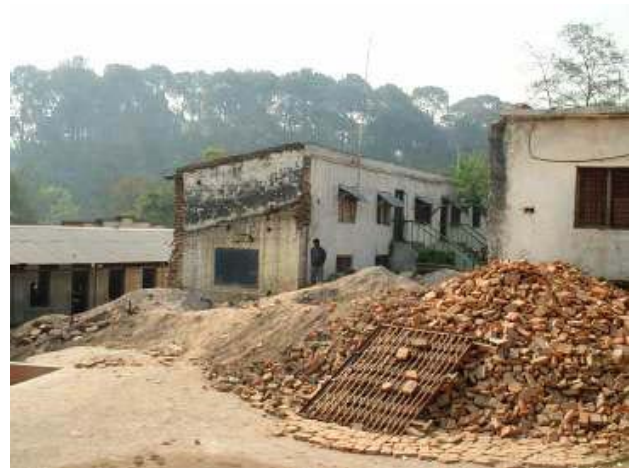
Aushubarbeiten für den Erweiterungsbau von Round Table 182 Tübingen-Reutlingen der Sahayogi-Schule.