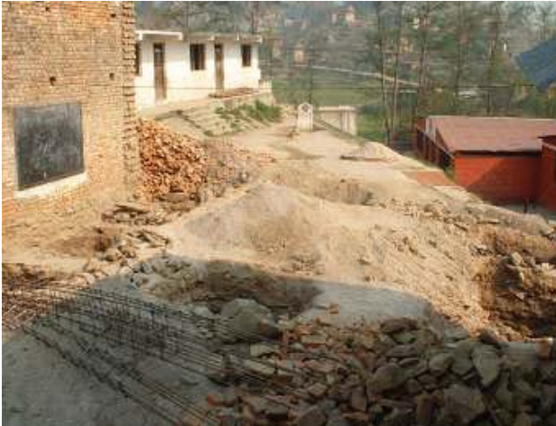
Aushubarbeiten für den Erweiterungsbau von Round Table 182 Tübingen-Reutlingen der Sahayogi-Schule.