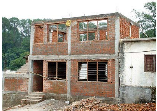
Das erste Obergeschoss entsteht. Insgesamt 80 Schüler werden in den beiden Klassenräumen Platz finden.